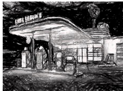
ガソリンスタンド